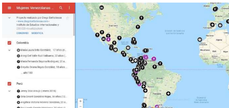
Imagen 1 - Mapa de casos de muerte y desaparición de mujeres venezolanas migrantes y refugiadas 39

Por lo que se refiere a la violencia sufrida por las mujeres migrantes venezolanas en Colombia, podemos hacer referencia a la publicación, en agosto 2019, de un mapa interactivo 38 que recopila los casos de muerte y desaparición de mujeres venezolanas migrantes y refugiadas en el mundo. A través de este mapa se muestra la situación de violencia y discriminación que sufre este colectivo en los países de acogida y en el proceso migratorio. Los casos se enmarcan en una temporalidad que cubre desde 2012 hasta la actualidad. Destaca en negativo la situación de violencia que dichas mujeres sufren sobre todo en Colombia, donde se registra la mayor cantidad de casos de muertes y desapariciones.