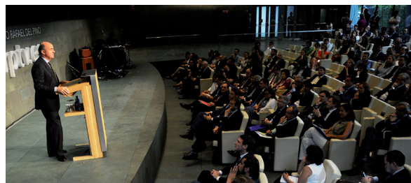
El Ministro Luis de Guindos clausurando el PLCE 2016.